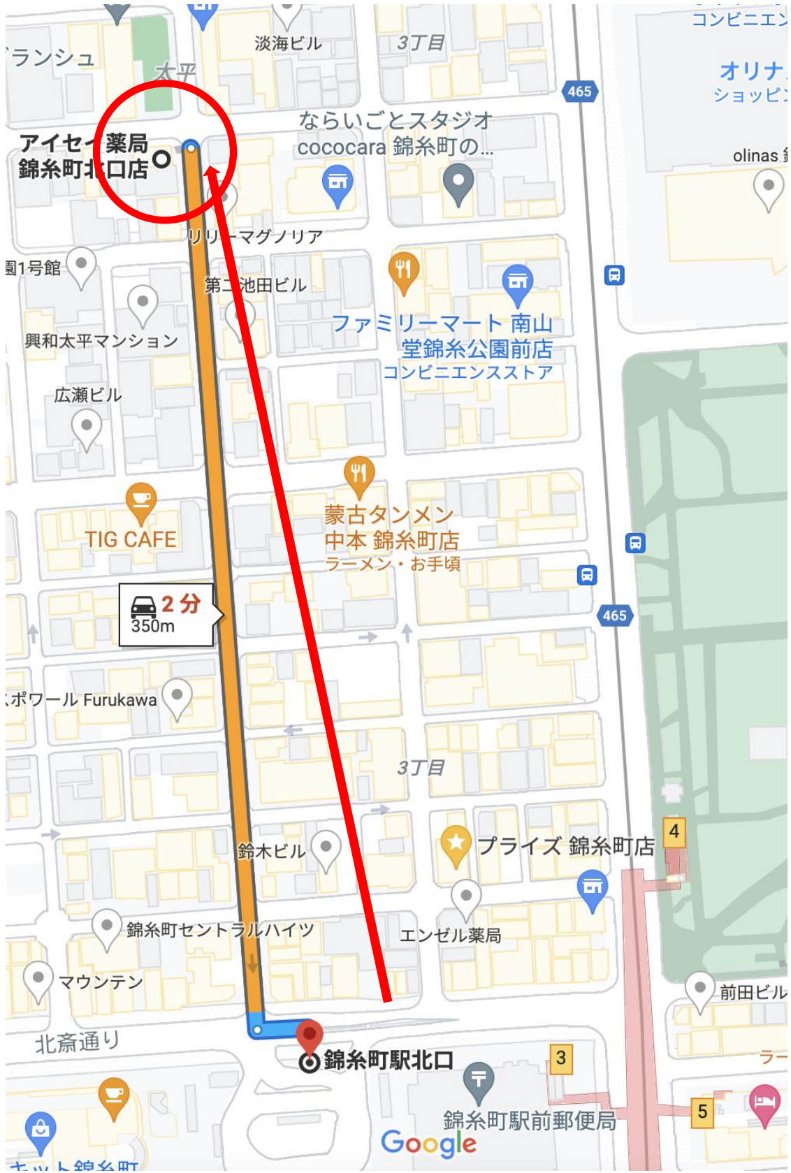
アイセイ薬局 錦糸町北口店、〒130-0012 東京都墨田区太平2丁目5-7 KOWAIII ビル